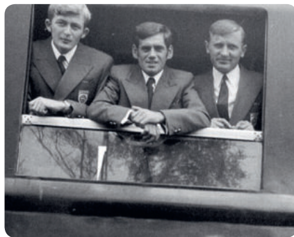
Indulás 1972 München

A rendkívül nehéz pálya, valamint a verseny előtti este bekövetkezett felhősza-