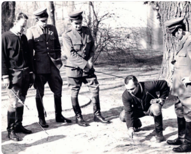
Military Csapat München 1972