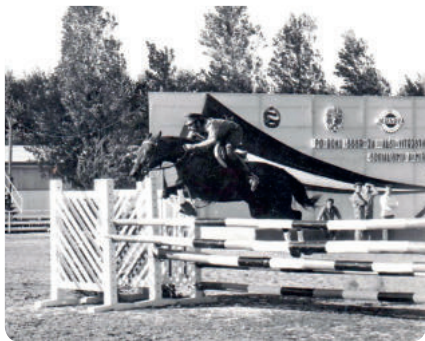
Ákos Ajtony és Őzike